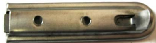
K-109 L=68 B=18 H=9