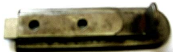
K-107 L=70 B=21 H=14