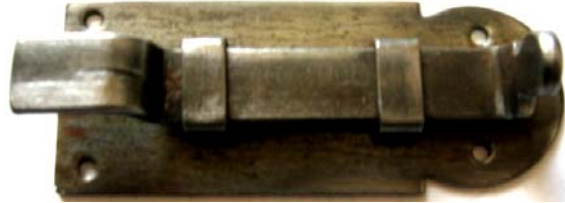
K-115 L=80 B=30 H=11