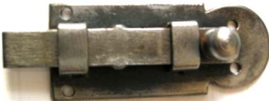
K-106 L=61 B=26 H=11