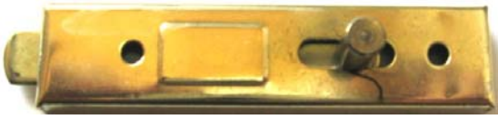
K-112 L=73 B=17 H=11