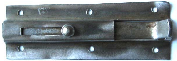
K-118 L=90 B=30 H=21