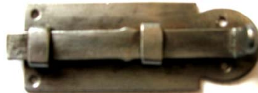
K-105 L=64 B=27 H=17