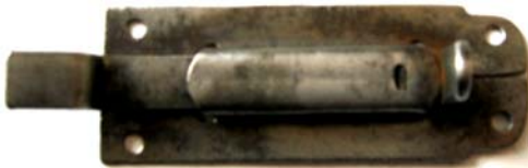
K-102 L=60 B=22 H=9