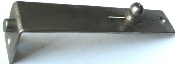
K-123 L=90 B=17 H=15