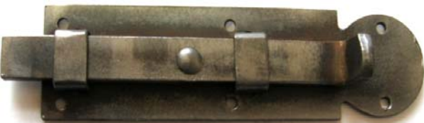
K-120 L=100 B=27 H=29