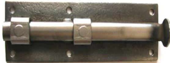
K-119 L=90 B=30 H=18