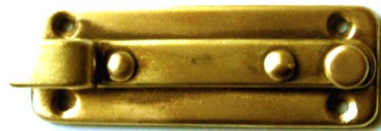
K-103 L=60 B=21 H=13