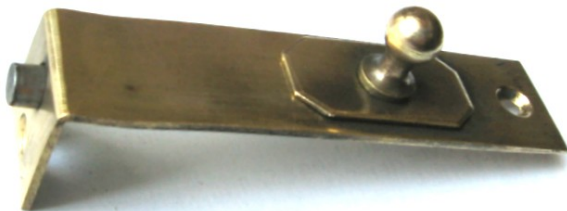
K-122 L=75 B=20 H=11