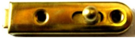
K-101 L=50 B=12 H=8