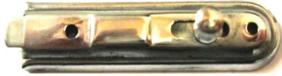
K-113 L=73 B=18 H=11