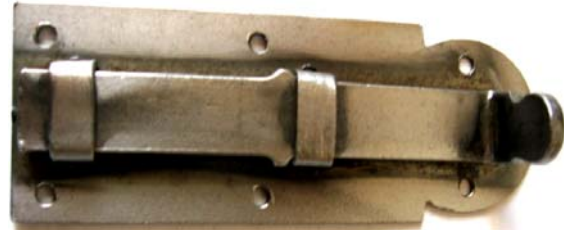
K-121 L=115 B=37 H=29