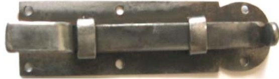
K-117 L=89 B=24 H=18