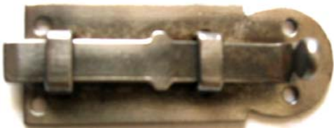
L K-104 L=60 B=23 H=14